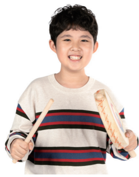
▲ 바른 자세