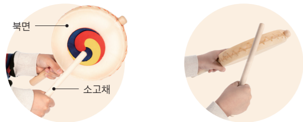
▲ 북면 치기